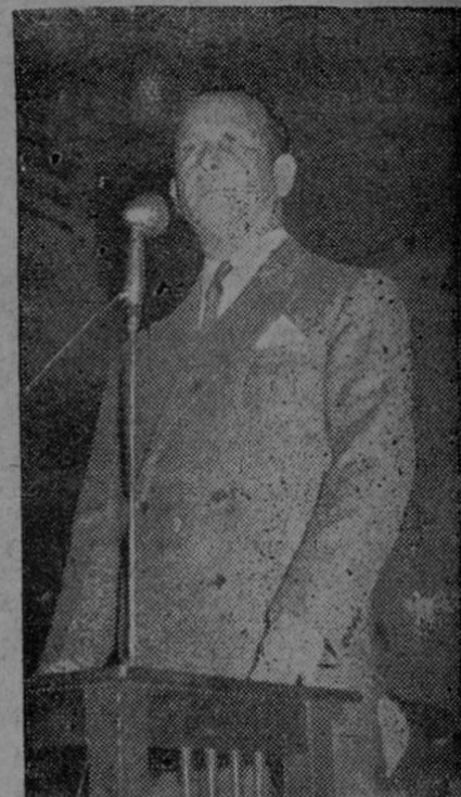
Dr. Ismael GONZALEZ AREVALO Embajador de Guatemala

“Guatemala no está sola. Ni la calumnia ni la amenaza del imperialismo y de los políticos criollos que le (Pasa a la Pág. 2)